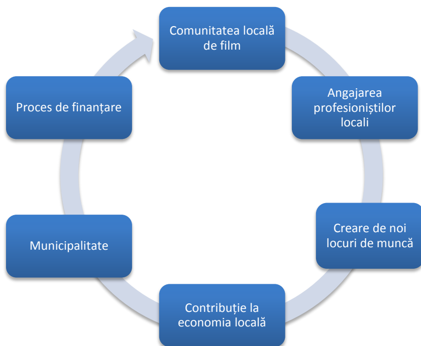
Fig. 1.1 Viziune antreprenorială pentru sectorul cinematografic în Cluj-Napoca

O componentă foarte importantă în profesionalizarea sectorului cinematografic la nivelul orașului Cluj, o reprezintă implicarea activă a comunității de film deja existente. Încurajarea colaborării cu profesioniști de film formați în Cluj, deci crearea unor noi locuri de muncă, trebuie întreținută în mod activ prin gândirea unor beneficii de ordin fiscal sau disponibilizarea unor finanțări pentru acele proiecte derulate cu profesioniști locali. Un circuit de acest tip este, în fapt, un model de business pentru economia locală pe care îl reluăm sintetic mai jos: